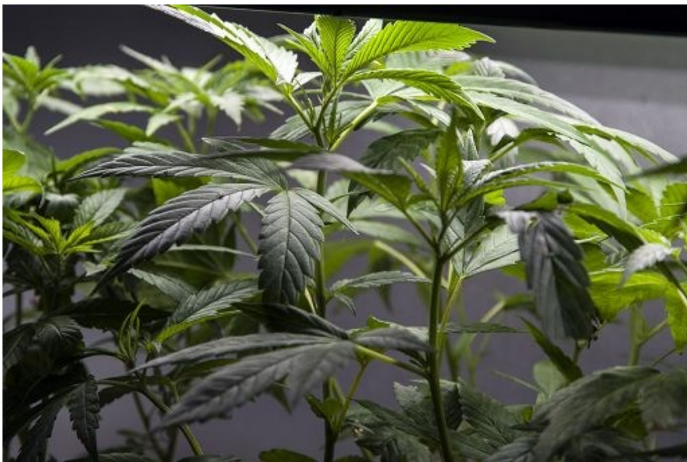
Allerta su sostanze letali in prodotti venduti come cannabis "light"

Ritaglio ad uso esclusivo del destinatario